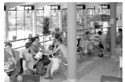
Beispiel Bistro (Wasserwelt)