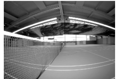
Beispiel offen (3 Felder)