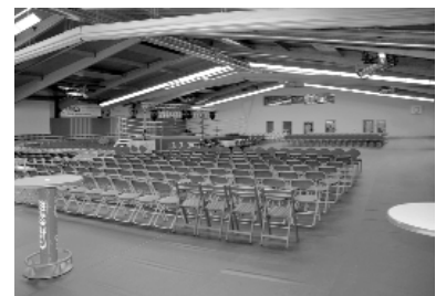
Beispiel Event (3 Felder)