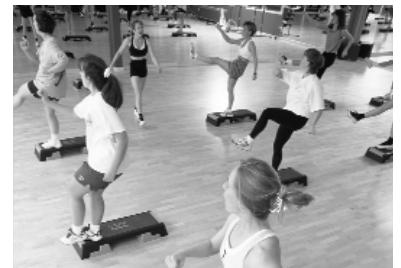
Beispiel Kurs „Step Aerobic“